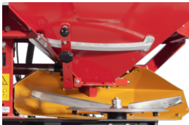
Ancho de trabajo ajustable desde el tractor. Discos y aletas esparcidoras en acero inoxidable.