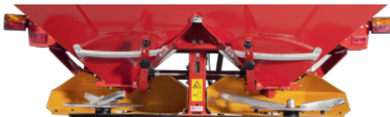
Sistema esparcidor de doble disco para un mayor ancho de trabajo y más precisión en la distribución del abono.