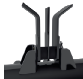
3 Cuchillas (opcional)